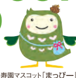
松寿園マスコット「まっぴー」